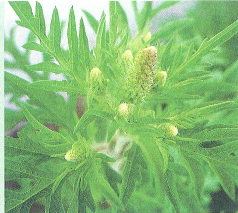
Im Juli werden Blütenstände sichtbar, die frühen Pflanzen beginnen zu blühen.