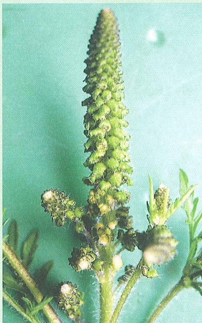
August und September ist die Hauptblütezeit, späte Pflanzen blühen bis im Oktober.