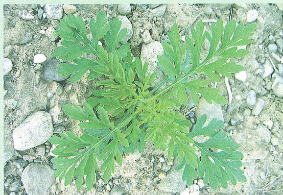
Ende Mai erreichen die frühesten Pflanzen eine Höhe von 10–15 cm.