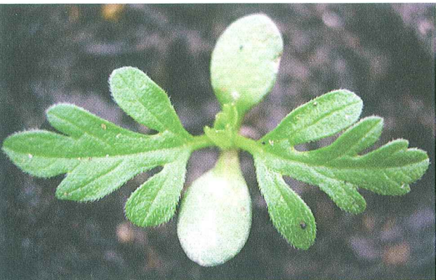
Keimpflanzen sind ab Mitte April bis Anfang September vorhanden. Die Hauptkeimzeit dauert von Mitte April bis Mitte Juni; nach einer Bodenbearbeitung laufen bis Anfang September neue Keimlinge auf.