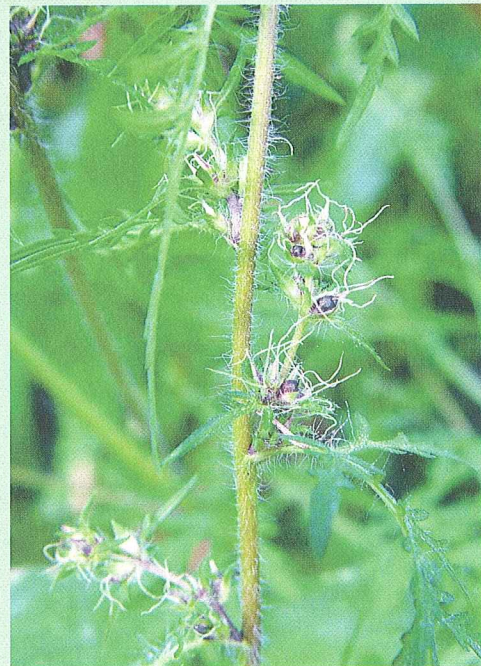
Erste Samen sind ab Anfang September reif.